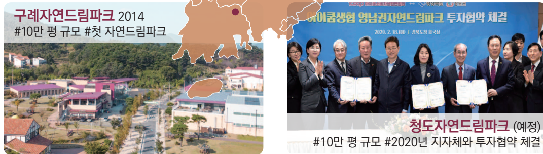
구례자연드림파크 2014 #10만 평 규모 #첫 자연드림파크