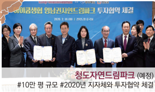
청도자연드림파크 (예정) #10만 평 규모 #2020년 지자체와 투자협약 체결