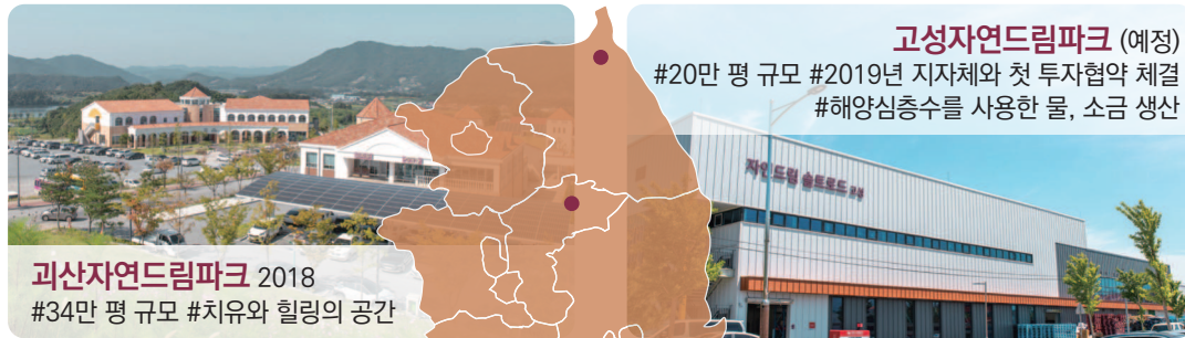
고성자연드림파크 (예정) #20만 평 규모 #2019년 지자체와 첫 투자협약 체결 #해양심층수를 사용한 물, 소금 생산

산업과 일자리는 기본, 교육, 의료, 복지, 문화 기반을 갖춘 혁신적인 비즈니스 모델을 전라남도 구례와 충청북도 괴산에 실현하였으며, 추후 경상북도 청도군, 강원도 고성군에 자연드림파크를 조성해나갈 예정입니다.